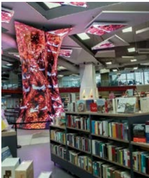
Librería Carlos Fuentes. Guadalajara, México.

Obras escritas por nuestros docentes y publicados por nuestra Editorial UNSTA. Relaciones Internacionales, Filosofía, Álgebra, Literatura, Historia, Inglés y psicología fueron las temáticas elegidas para libros que viajaron.