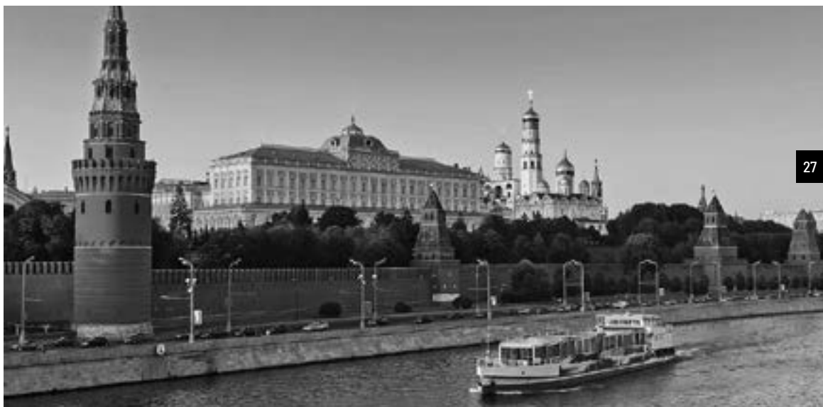
El Kremlin (también conocido como "La casa Blanca rusa") desde el Río Moscova.

Una ciudad enorme, moderna, dinámica y cosmopolita; muy limpia y segura, atravesada por grandes avenidas y bulevares, con muchas plazas, parques y jardines, llena de centros comerciales, cadenas de grandes hoteles, teatros (como el famoso Bolshoi, que significa grande) restaurantes, rascacielos (la zona céntrica de Moscú City) y un complejo sistema de transporte que incluye 5 aeropuertos y su famoso Metro, que con 177 estaciones, transporta diariamente a 8 millones de pasajeros. Y algo que llama la atención: en esta gran ciudad, la gente es, en general, amable; trata de ayudar, parece tener buen ánimo y muy buena voluntad.