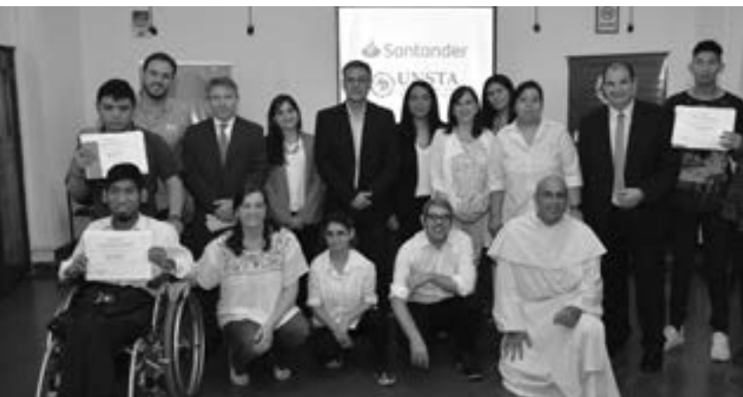
Banco Santander Otorgo los certificados de becas a los primeros beneficiarios de este espacio.

Próximamente se compartirán los relatos enriquecedores de los participantes por las experiencias que recién se inician.