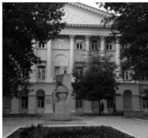
Universidad Lingüística de Moscú.

La Federación de Rusia , está conformada por: 20 repúblicas; 6 territorios, 49 provincias, 2 ciudades (Moscú y San Petersburgo) y 10 regiones autónomas. En ellas, habitan 145 millones de personas de distintas etnias, culturas, lenguas y religiones que conviven sin conflictos. Su capital es Moscú. La ciudad más grande de Europa, en la que viven 17 millones de personas.